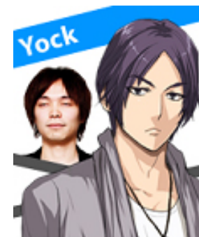
擔任手相師 帶有神秘感的天然呆