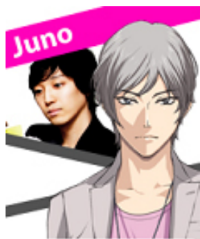
擔任塔羅與占星術師 酷酷團長