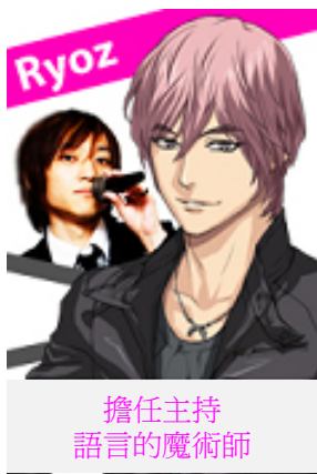
擔任主持 語言的魔術師

在大學裡專攻東洋思想。受到道教、老莊思想的影響，對易經產生興趣，於是展開以易經塔羅為占卜術的占卜師活動。他以出生年月日為根基，運用數字來占卜人生的基本趨勢，這種占卜方式就是「數秘術」占卜。他也以 hoxaigraphics 的名義從事藝術總監的活動，同時擔任 not for sale. 的藝術總監，負責影像與網站設計等。