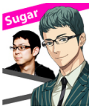
擔任占星術師 知性草食男

NFS 的團長。將占卜師定位為「問題解決者」，不侷限於占卜師的框架下，無需面對面算命，就能透過各種媒體，將自己預測的占卜內容傳送給您，每月約有 500 萬名用戶。目前正在展開將「日本占卜術推展到海外」，其中特別對亞洲大力推廣，同時在日本的 COOL JAPAN 政策下，除了動畫、漫畫、遊戲之外，也致力在遊說活動中加入占卜內容。